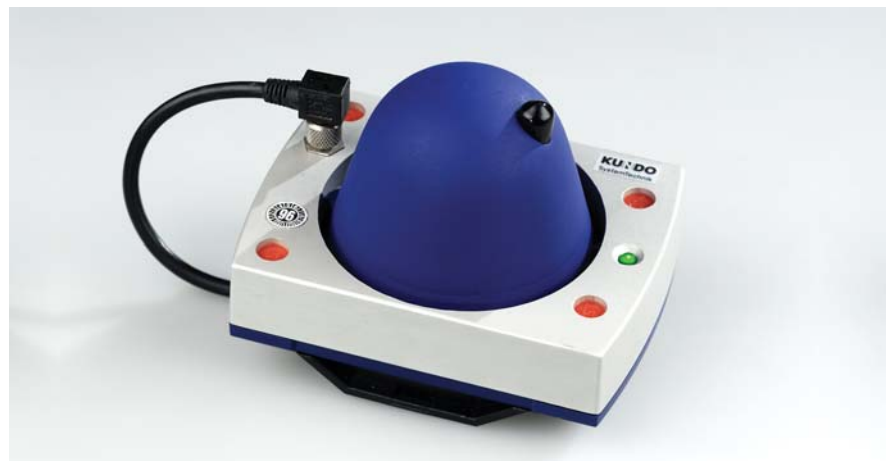
SQS CO 2 CONTROL Sensoreinheit

Die Sensoreinheit im kompakten Aluminium-Druckgussgehäuse ist sehr unempfindlich. Der Anschluss erfolgt über einen Steckverbinder. Für die wiederkehrende Prüfung ist ein spezieller Anschluss für Prüfgas integriert.