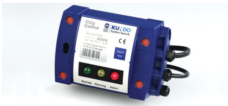
SQS CO 2 CONTROL Warneinheit